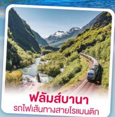
ฟลิมส์บานา รถไฟเส้นทางสายโรแมนติก