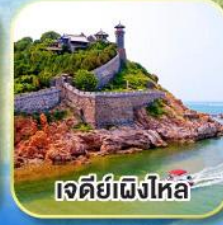
เจดีย์เฝิงไหล