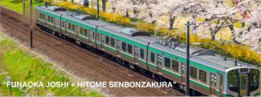
"FUNAOKA JOSHI + HITOME SENBONZAKURA"