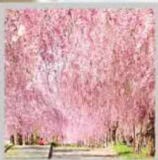
"NICCHUSEN WEEPING SAKURA"