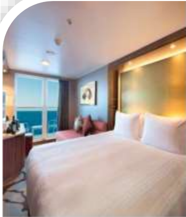
Oceanview Stateroom with Balcony